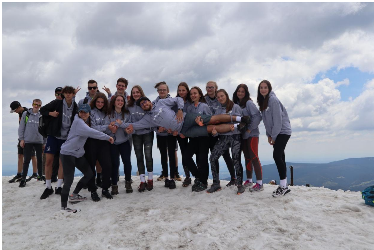
Turistický kurz 9. roč.