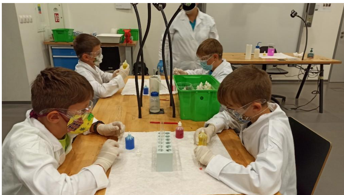
Vida centrum Brno -5. roč.