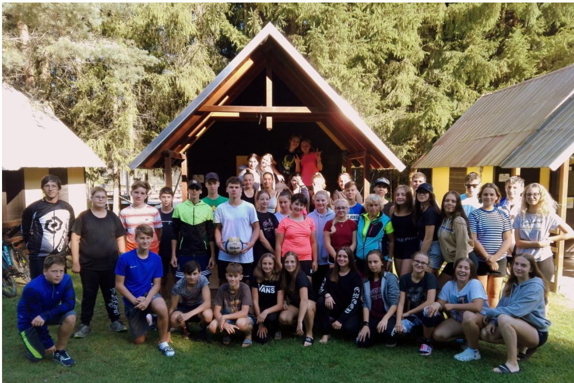
Cyklistický kurz 9. A, 8.B