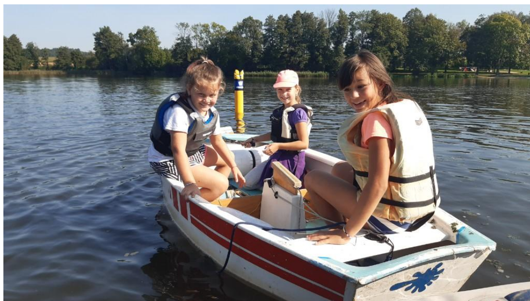
Kurz jachtingu – 4.B