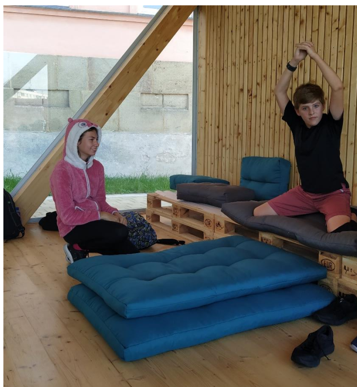
Využití venkovní učebny k dramtizaci textu