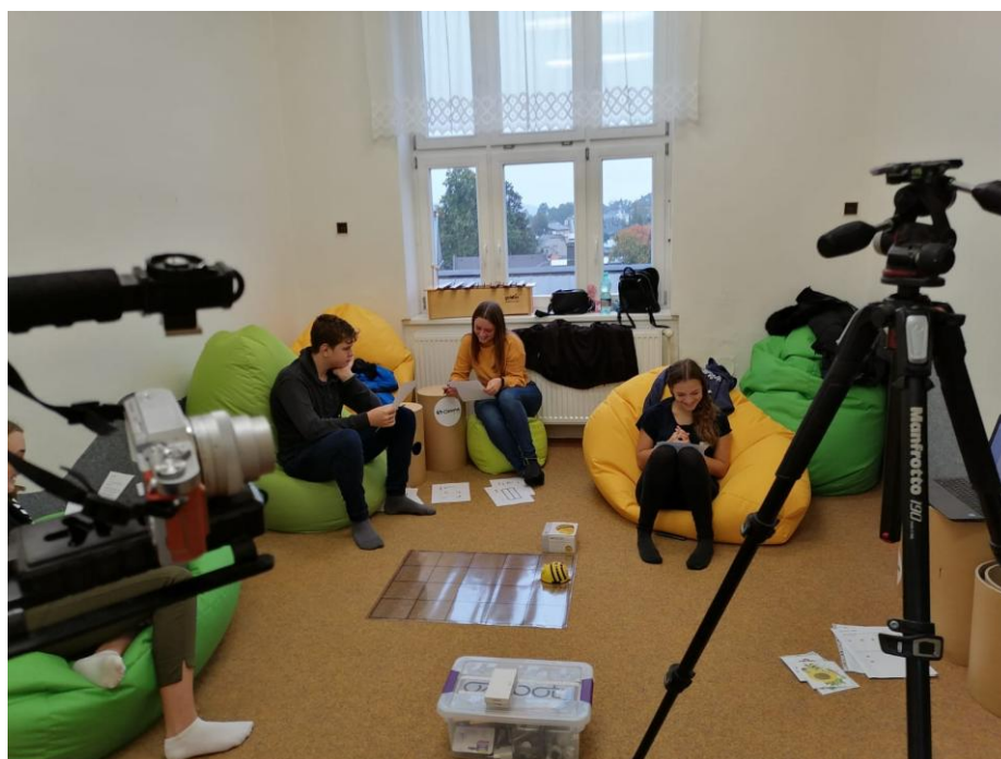
Meet and Code ve škole