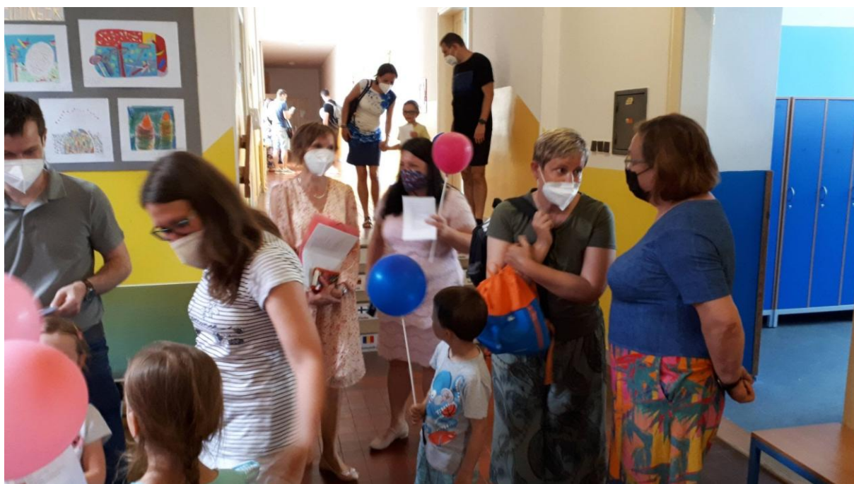
Schůzka s budoucími prvňáčky