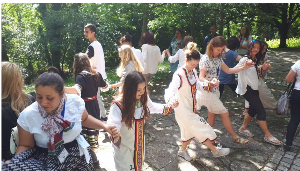
Mobilita Erasmus+ Bulharsko