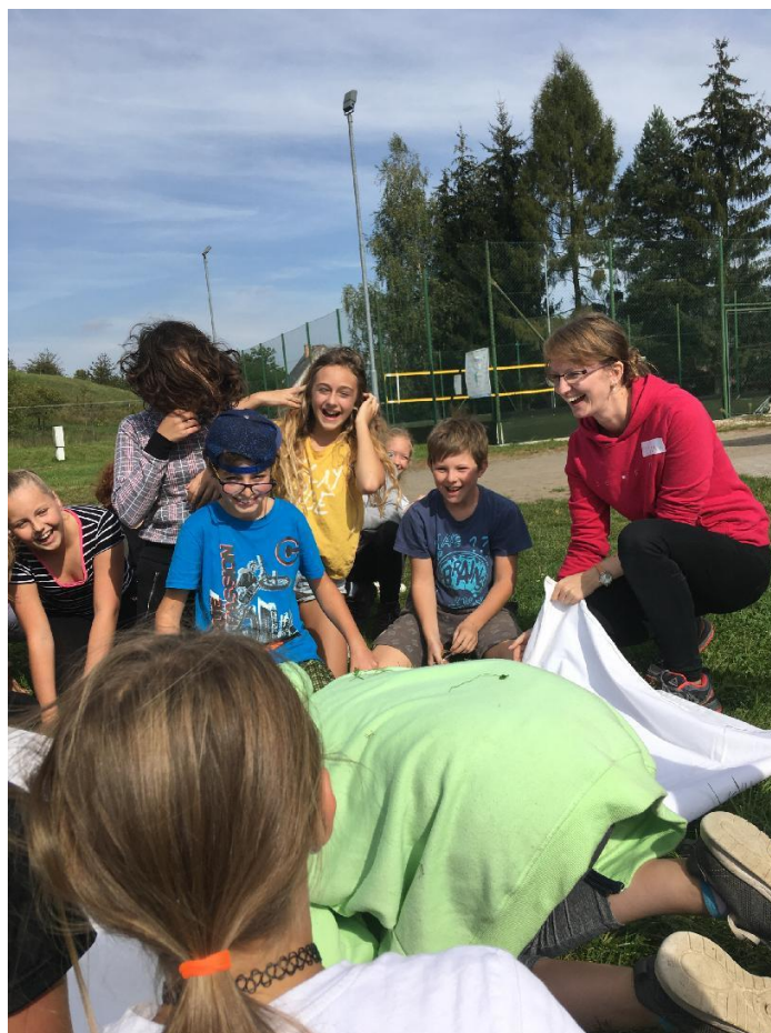
Adaptační kurz 6.roč.