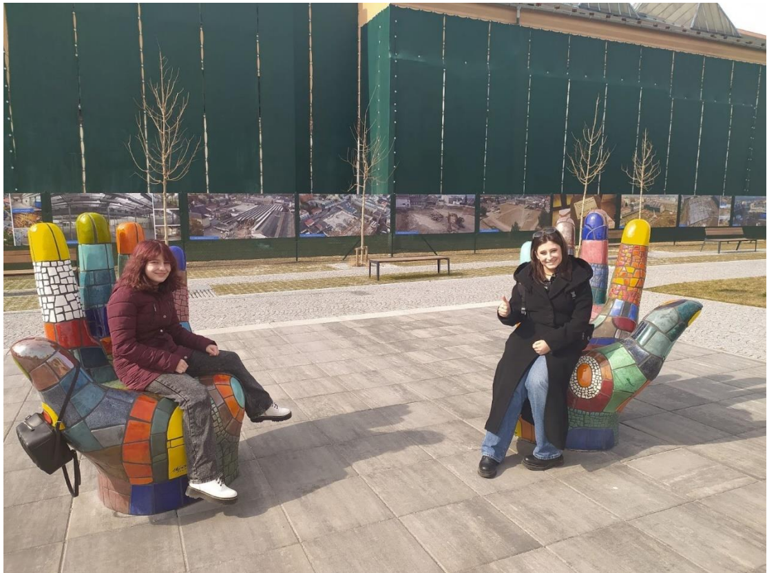
Okresní kolo v anglickém jazyce