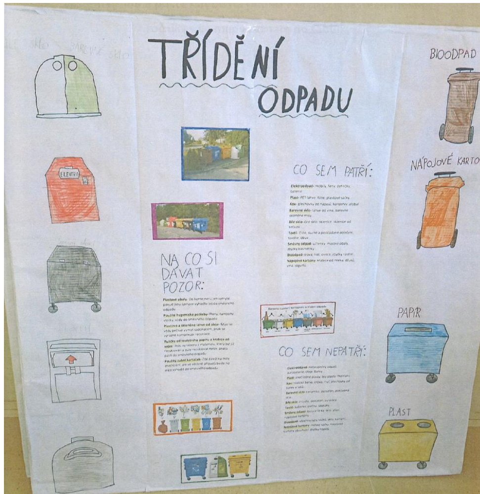
Jeden z výstupů ekologického projektu