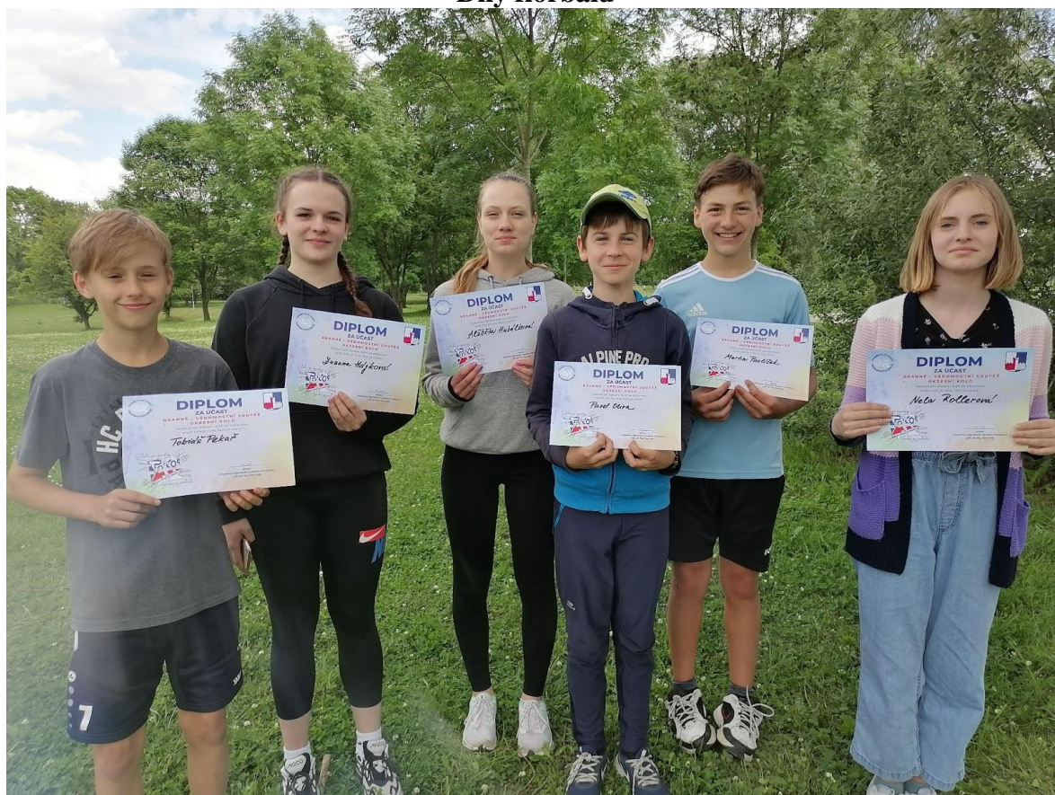
POKOS – branně-vědomostní soutěž