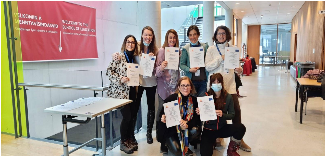
Erasmus+ na Islandu