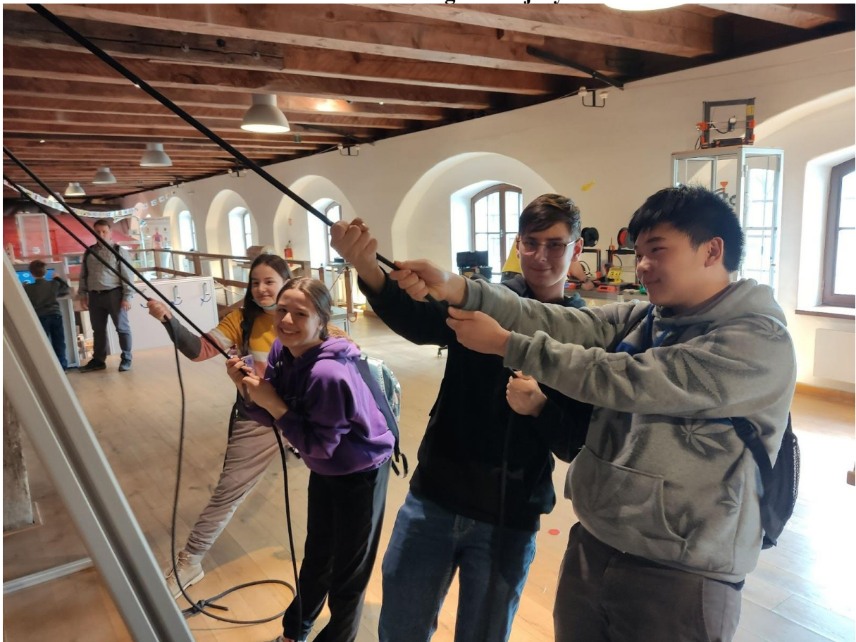
Dějepisně-přírodovědná exkurze v Olomouci