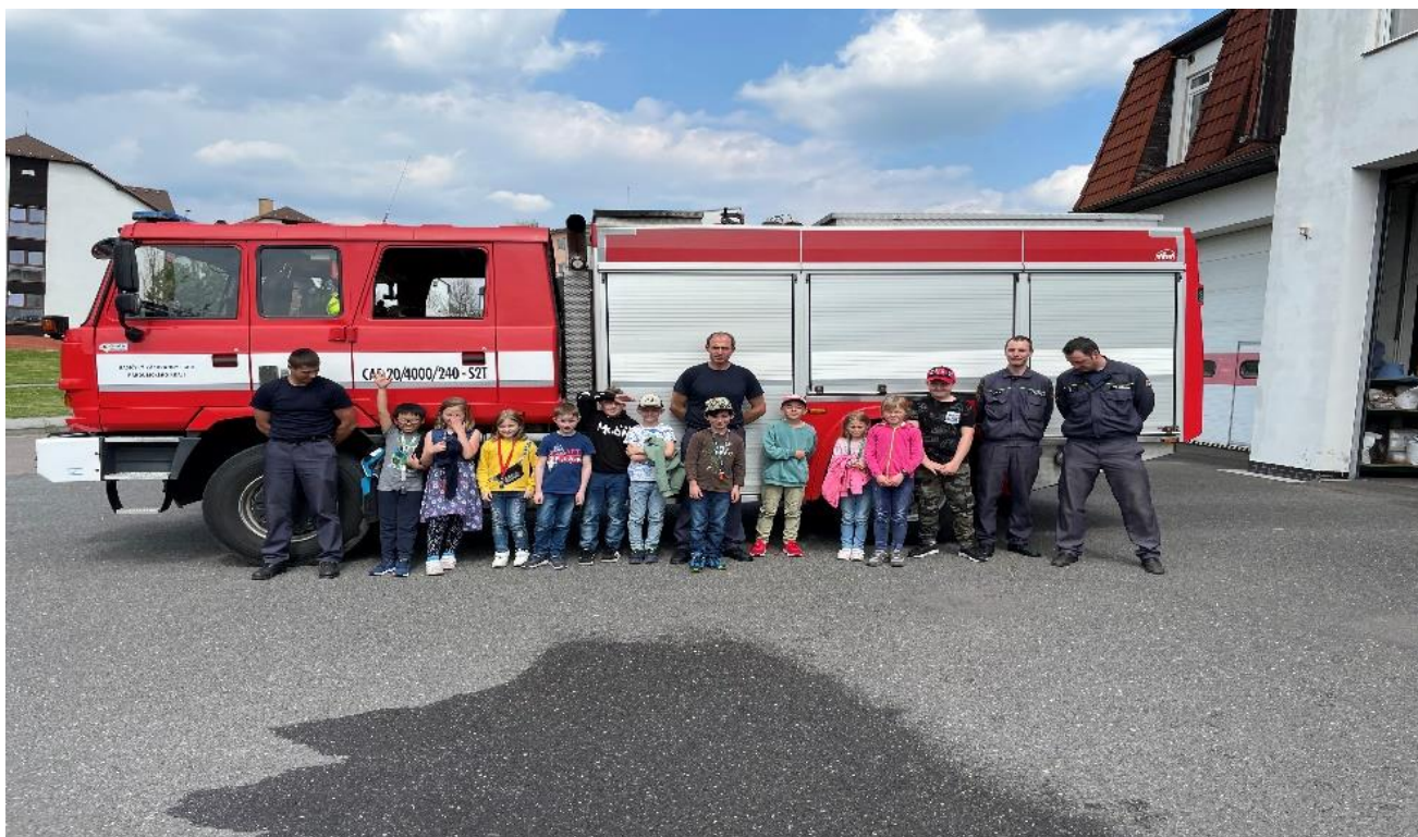
Návštěva u hasičů