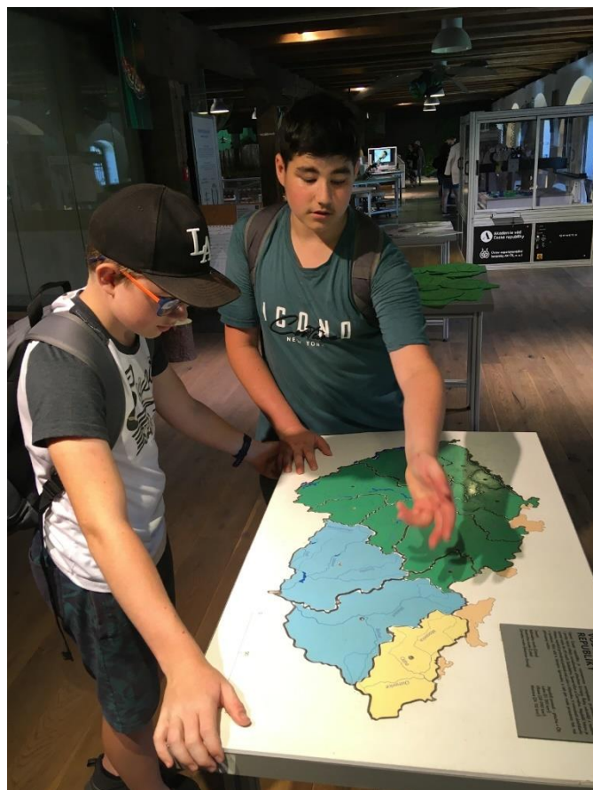
Dějepisná exkurze Olomouc