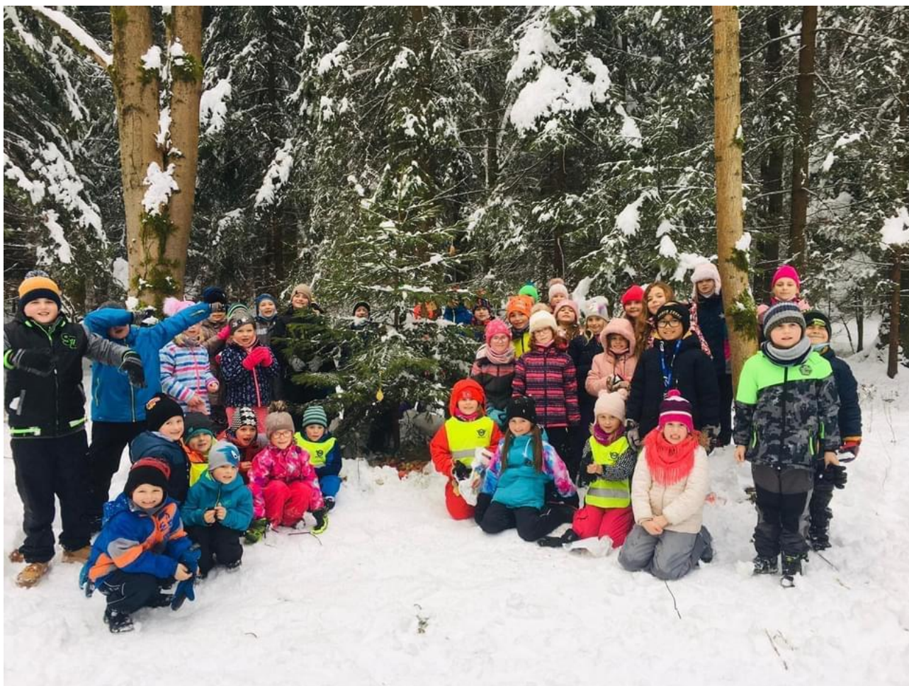
Vánoce pro zvířátka