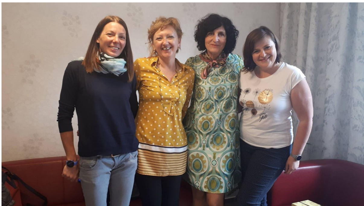
Stínování italských kolegyně