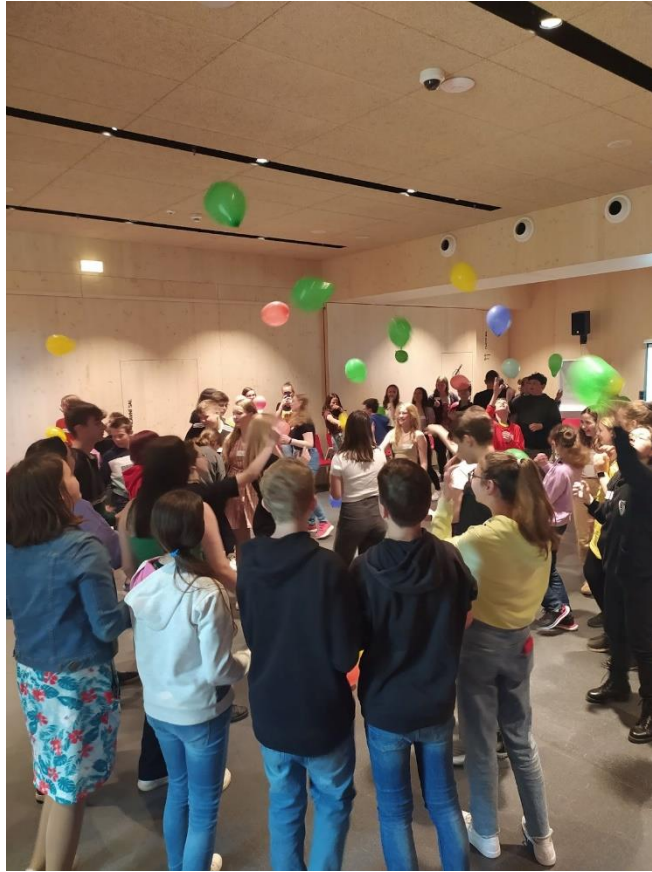
Městský žákovský parlament