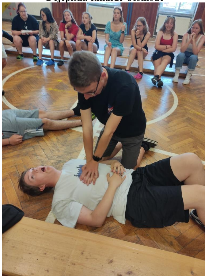
Kurz První pomoci