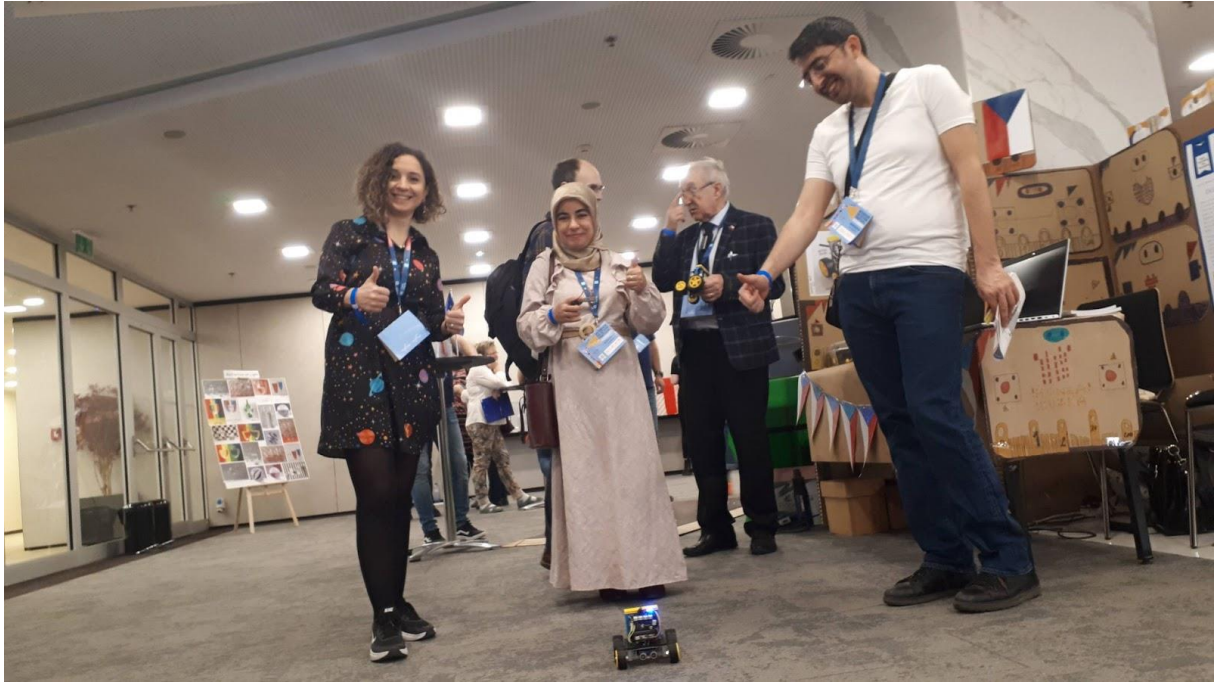
Science on stage