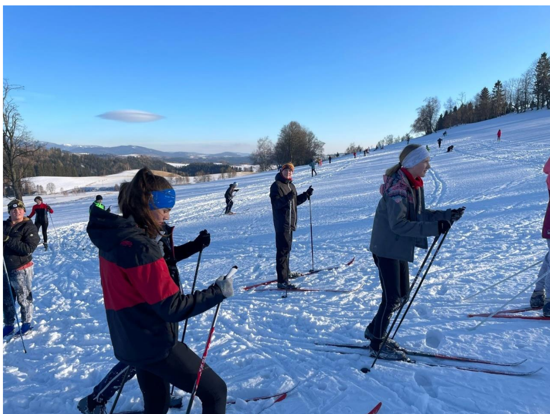
Lyžařský kurz 2.st.