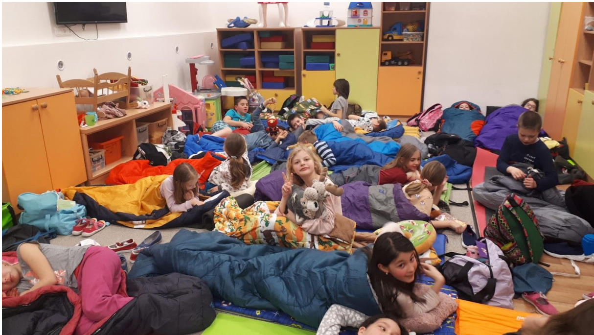
Noc s Andersenem