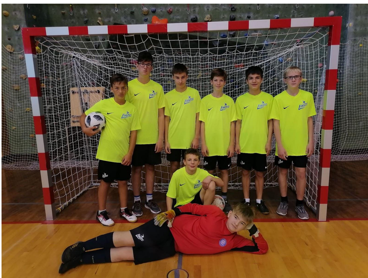
Školní futsalová liga