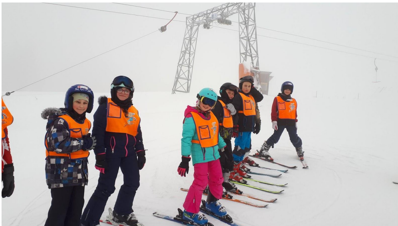
Lyžařský kurz 1.st.