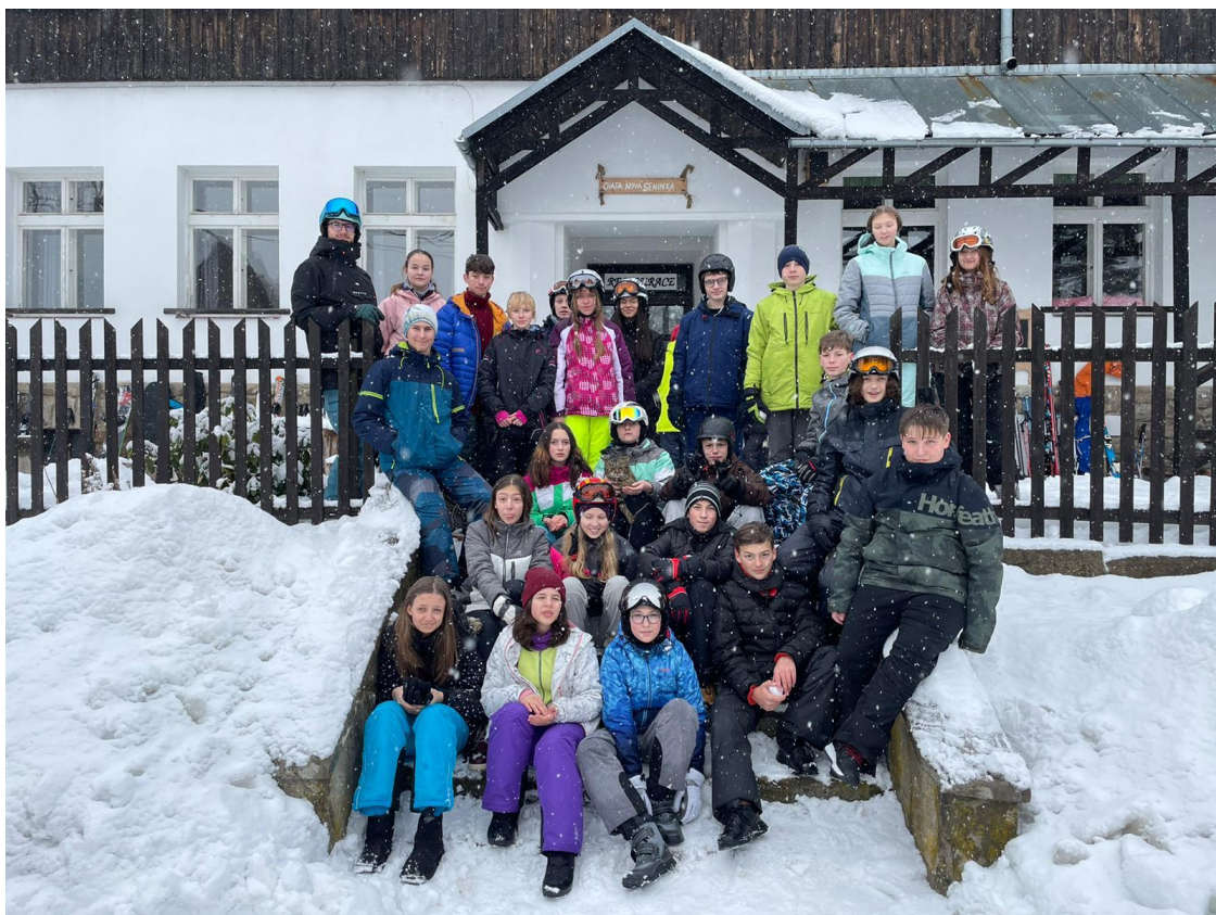
Lyžařský kurz 2.st.