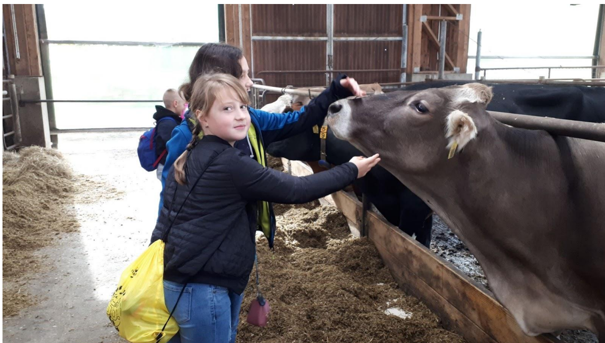
Spolupráce se SZeŠ