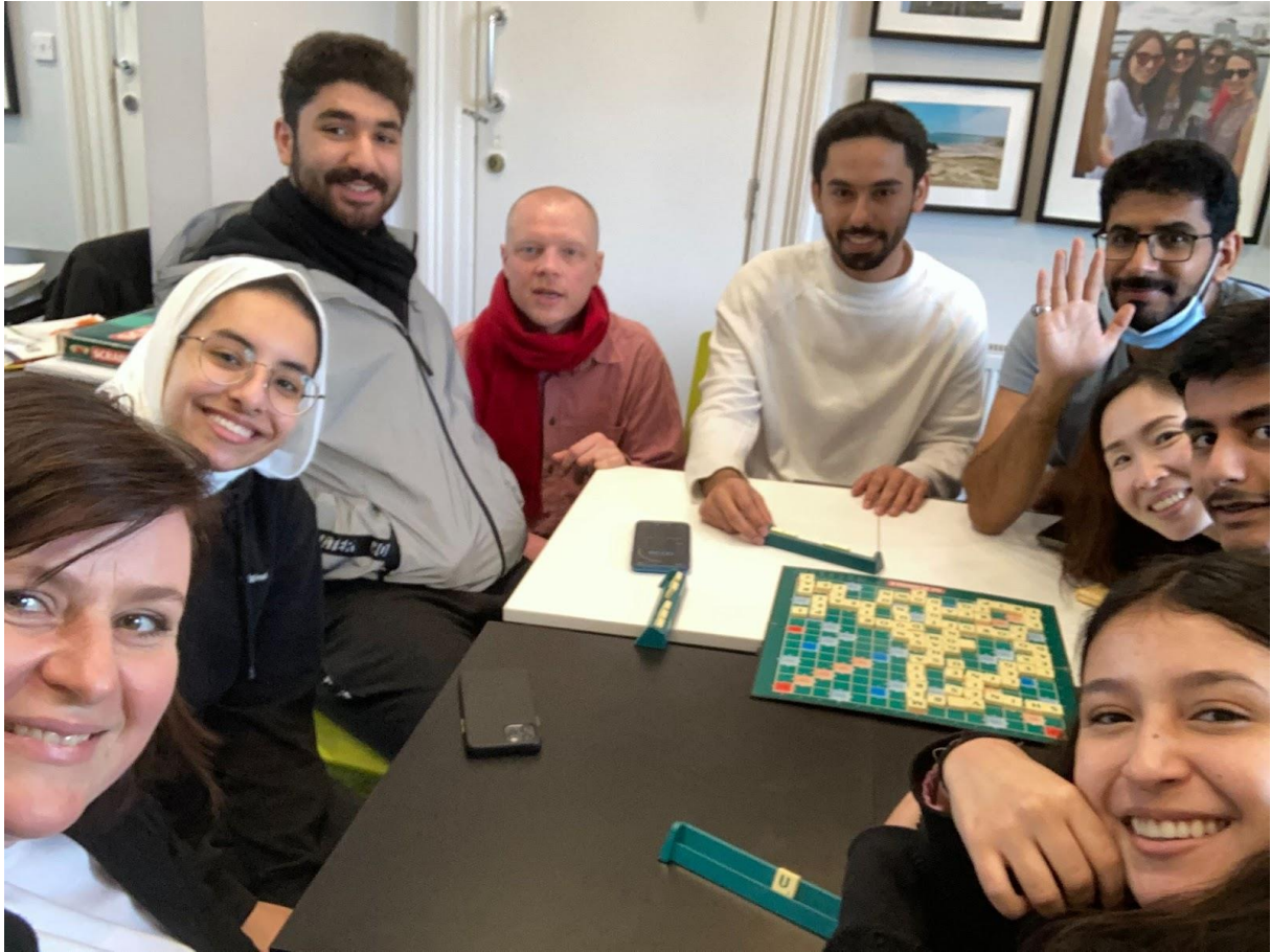
Erasmus+ ve Velké Británii