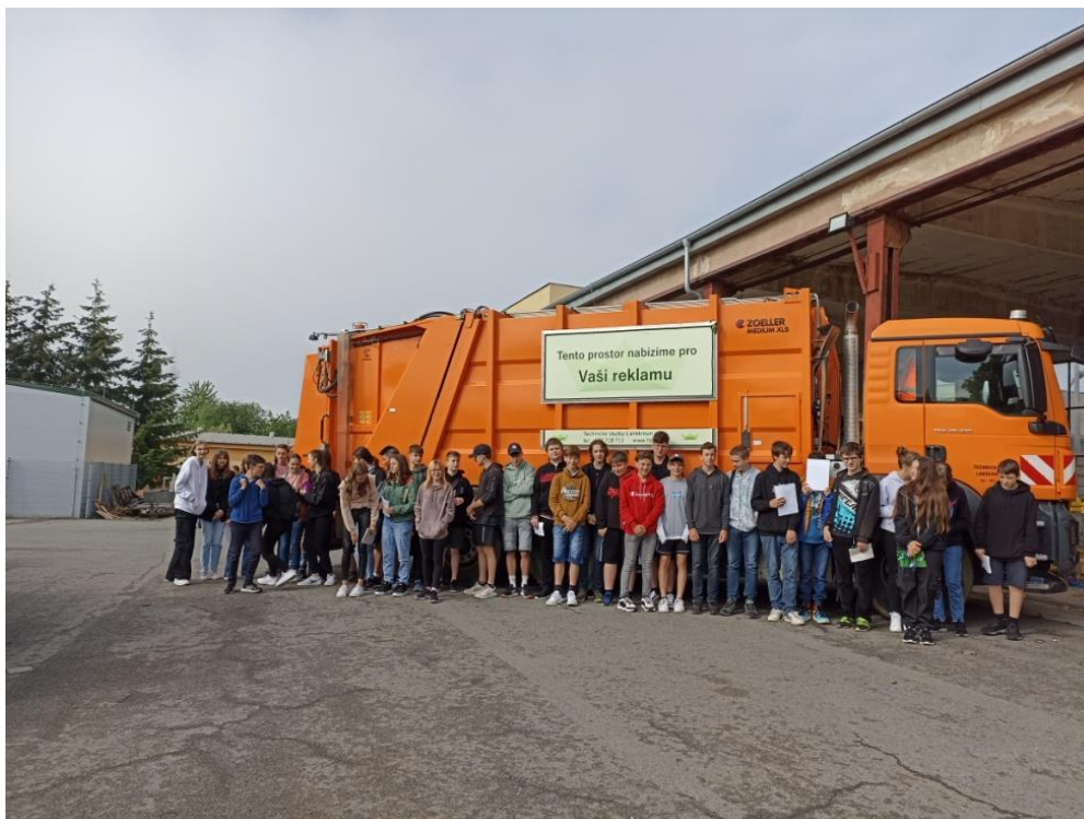
Návštěva technických služeb v rámci ekologického projektu